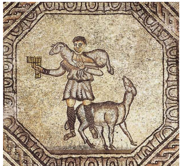
De goede herder. Mozaïek in de kerk Santa Maria Assunta, Aquileia (Italië), 4 e eeuw

Muziek (cello) Springsong van Frank Bridge