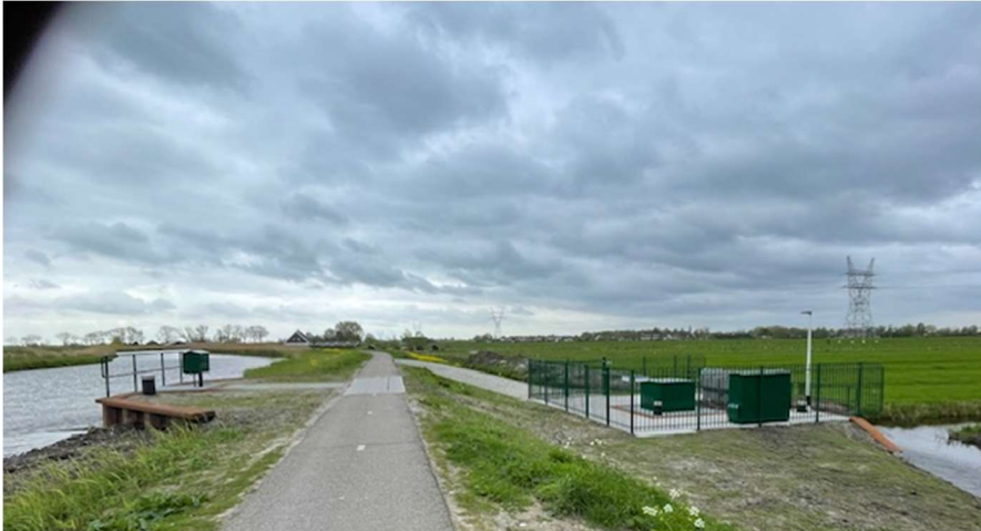
De nieuwe sluis bij het oudelandsdijkje bij Ipendam is gereed. Een groot water verschil tusen het waterpeil van de Purmerringvaart en de sloten in de Vurige Staart.